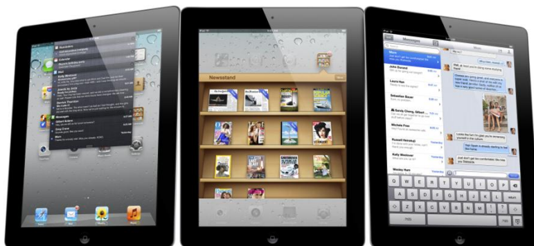
Mynd 1: Spjaldtölvur eru til margra hluta nytsamlegar.