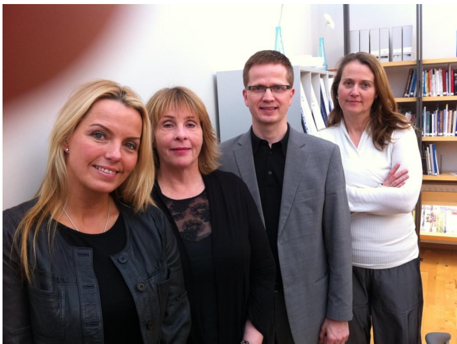
Mynd 2: Dómnefndin sem valdi jólagjöfina 2011

Dómnefndina skipuðu (frá vinstri á mynd):